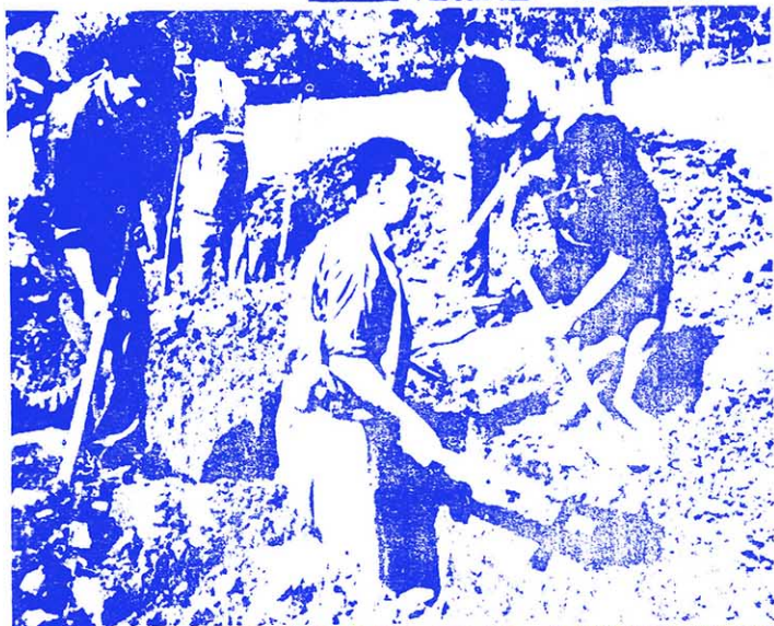
①阿尔巴尼亚人民的敬爱领袖 恩维尔·霍查同志和诺沃赛莱农业合作社社员在一起。