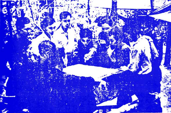
▲ 南越解放军执行正确的军事路线，充分发扬军事民主。图为某部指挥员们在研究作战方案。