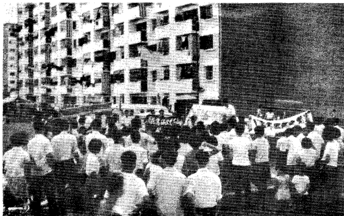
◀大巴客群眾，手舉“血債必須用 血來還！”、“抗議李光耀傀儡政權 迫害反帝戰士！”等布條，集聚於巴 利旁，以揚聲器向群眾廣播。