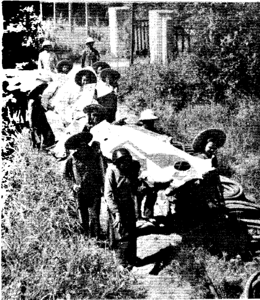
◀北越女民兵正在抬走被擊落美強盜飛機殘骸。