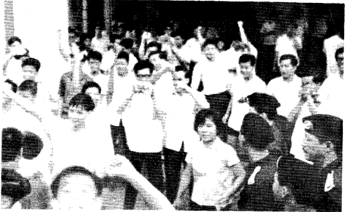
望的親友揮手致意。 西斯法庭後，步出庭外向前來探 右圖：二六二同志被無理控上法

語 錄 毛主席說： 真正的男女 平等，只有在整個社會 的社會主義改造過程 中才能實現。