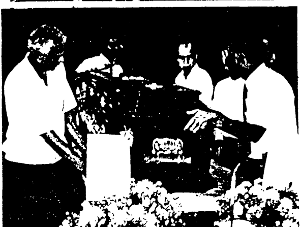
一代政治紅人林清祥先生殞落，親友們向他致最後敬禮。