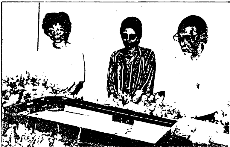
英雄惜英雄 另一位著名英雄人物---左翼律師 T .T.Rajah (右) 不幸於三月十三日早晨逝世。這是他瞻別林清祥遺容的珍貴鏡頭。

Demi masyarakat yang adil dan dunia yang cemerlang .