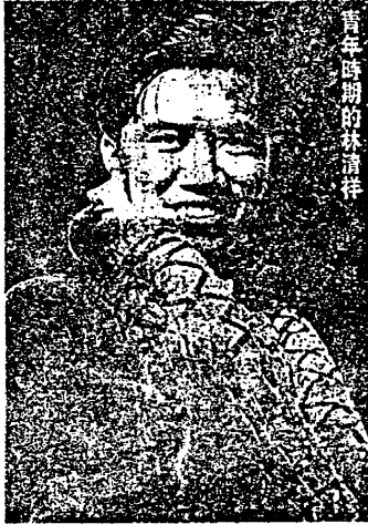
青年時期的林清祥

黨獻出了生命中最寶貴的歲月。」大家記憶猶新：五九年，人民行動黨以「爭取新加坡自治」，也以「釋放林清祥等政治扣留者」為競選訴求。大勝後，英國殖民地政府讓林清祥、方水雙、蒂凡那等二十名政治犯從拘留監獄走了出來，行動黨於是上台執政，李光耀順理成章當上新加坡第一任總理。