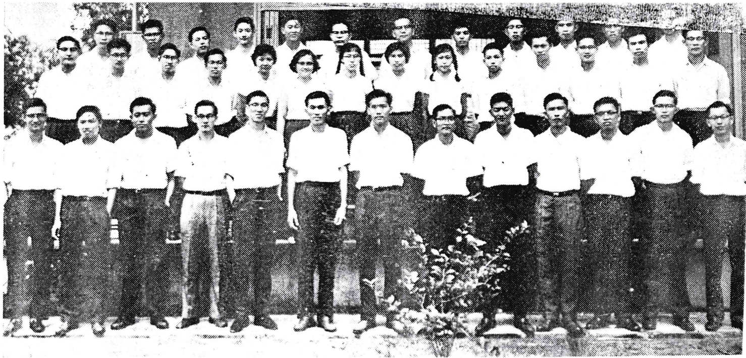
學生會第四屆執委合影