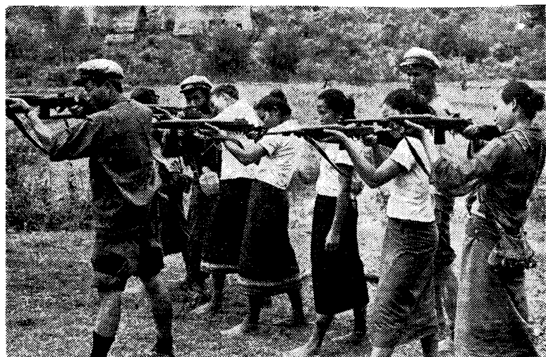
← 帝國主義。 老撾婦女學習射擊，準備狠狠消滅美