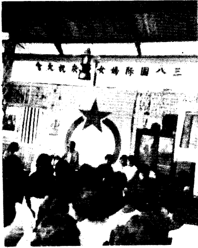
▲三八國際婦女大會在進行中。