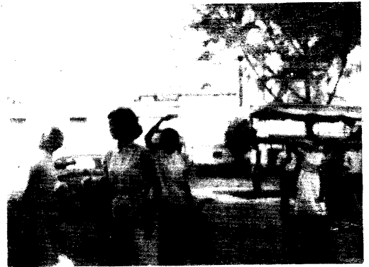
▲一九六四年九月十二日，人民群眾反對抽兵遊行，姐妹們英勇參加。圖示，一些被捕同志光榮坐牢後步出兀蘭牢獄之影。