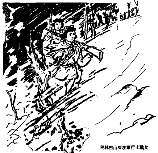
里林密山深在軍行士戰女

婦女同志在革命戰鬥中能吃苦耐勞，經得起嚴峻的考驗。一九三八年到一九四二年，東北游擊運動形勢逆轉。鬥爭處於極度艱難狀態，抗聯部隊每一個戰士身上負荷是很沉重的，除了槍械彈藥外，還得背上給養、服裝、小帳篷、小火爐、鐵鍋、斧、鋸和炊具等等。婦女同志還要攜帶藥包、針、線、尺、剪、補衣碎布，有時還背着成匹的布和縫紉機，如果男同志背包重四、五十斤，那麼女同志至少要四、五斤。她們身上負荷這樣沉重，無論寒暑，成年累月地作戰行軍。據我所知，沒有人怕吃苦受累的，更沒有逃亡叛變的。一九三九年初，正是嚴冬大雪的時候，日寇以兩個師團的兵力，把抗聯第五軍遮斷在牡丹江東岸刁翎地區，此時抗聯第二路軍總指揮以及直屬部隊三百餘人，其中包括婦女同志五十餘人，被另一部寇軍九千餘人包圍在江