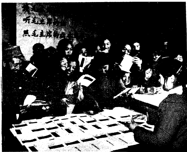
↑ 中國婦女積極學習，誓把毛澤東思想學到手。