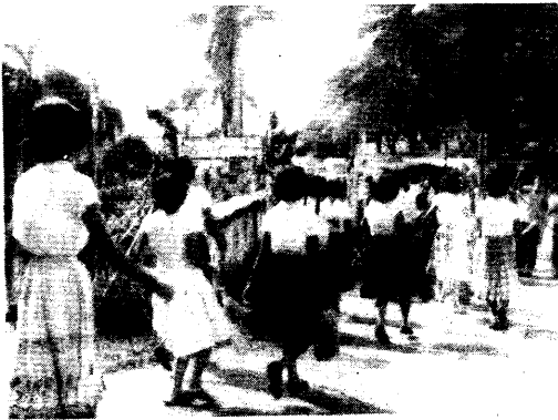
▲橫眉冷對反動派，牢獄嚇不倒我們革命硬骨頭。