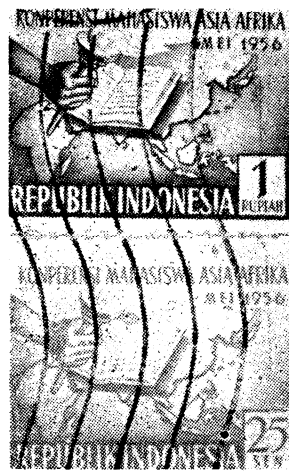
亞非學生會議紀念郵票

這次馬來亞的代表有不少是通曉三種語言的，即中文，巫文，英文，所以在與各國代表交談中顯得非常方便，如與中國、越南、朝鮮的代表可用華語，對於印度、巴基斯坦、埃及、日本的代表則用英語，對印尼當地的朋友則用巫語講，這也是馬來亞學生代表的一個特點。