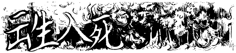
史賓塞·赤門著 俊彥譯

本文作者F.Spencer Chapman是個探險家，同時又是作家，曾到過西藏，格陵蘭，冰島等地探險，他所著的「森林是中立的」(Jungle Is Neutral)一書，為英國暢銷書之一。第二次世界大戰爆發，他被派來馬來亞擔任敵後工作。在森林的三年半中，經歷了許多可歌可泣的英勇事蹟。本文乃敘述作者在日軍後方三年半中所親歷的出生入死的驚險事蹟，特譯出以饗讀者。