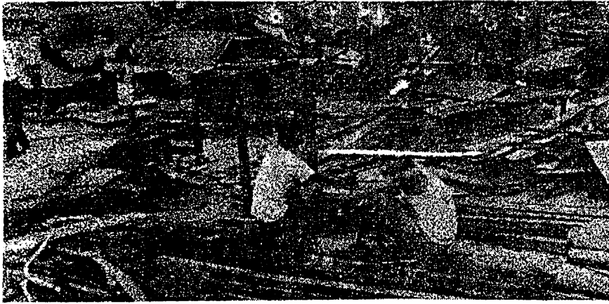
阿裕尼七小販攤位被行動黨政 ← 府用建國隊強蠻拆毀後的慘景。

小販們受迫害，今後生活無著落，感到憤怒異常，其中有幾位怒不可遏，寫了 [大馬] 繁榮？？數大字，掛在被拆毀的攤位上，向統治者表示嚴重抗議。→