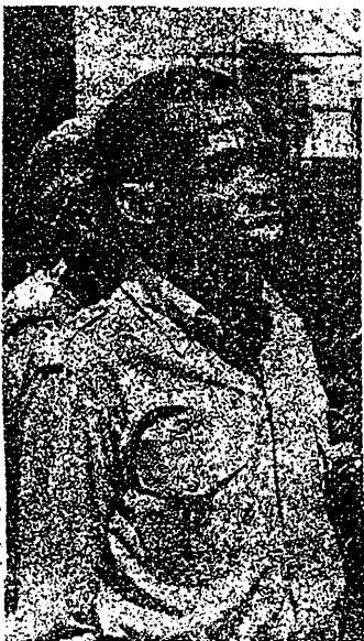
圖：剛果游擊隊領導人之一——蘇米亞洛

「農民、工人、知識份子都成了士兵以便保衛他們的土地、國家和文化，通過戰鬥學會了使用武器，他們日益掌握了軍事藝術。他們越是經歷戰鬥，他們就受到鍛鍊和變強大。人們向莫布杜的士兵說去克維盧漫遊，他們發現這種漫遊使他們當中有這許多人死亡，他們就失去勇氣了。他們上戰場時毫無斗志。許多士兵逃跑了，不久後，將是莫布杜成爲弱者和認勒爾成爲強者。」