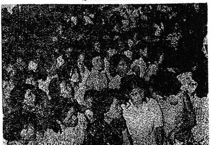
近千名受僱於英軍部家屬的女工，周日出席了由洋人僱員聯合會所召開的大會，抗議英軍部的無理解聘。圖為大會的熱烈場面。