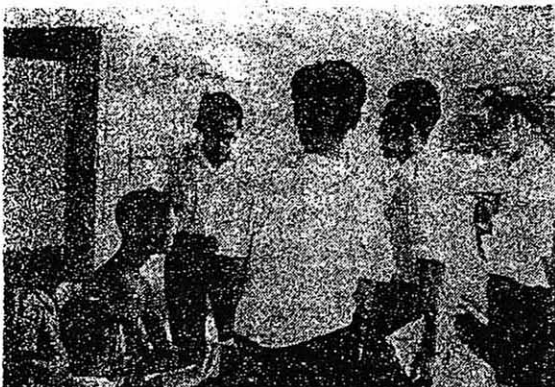
▲我黨訪問隊向乞羅卜區一位馬來同胞解釋黨的民族團結政策

預料第二周訪問之後，十萬張三種語文的告人民書，將分給十萬選民。不管行動黨如何控制電台、報章，靠著群眾的無比力量，黨的聲音仍然廣泛地被傳播出去。黨訪問工作委員會，目前正進行