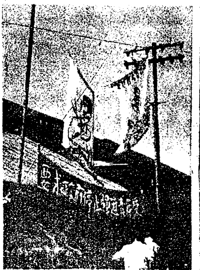
支部門前掛起慶祝布條

如今，每間宿舍只准住二人，夜間不得有五位同學在同一間宿舍溫習功課，違者【嚴重處罰】！