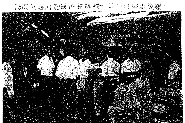
訪問同志向農民詳細解釋，如何如何來災難