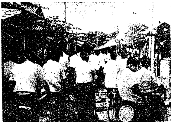
騎着鐵馬，出發訪問農民