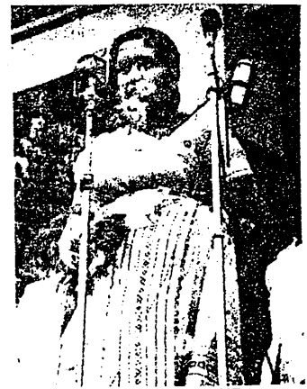
錫蘭總理班達奈特夫人