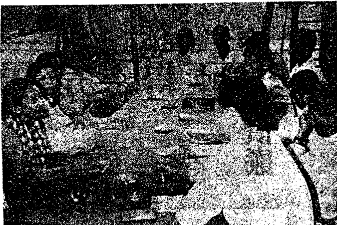
右圖：南越游擊隊在佈設竹筴陣，等候敵人前來。