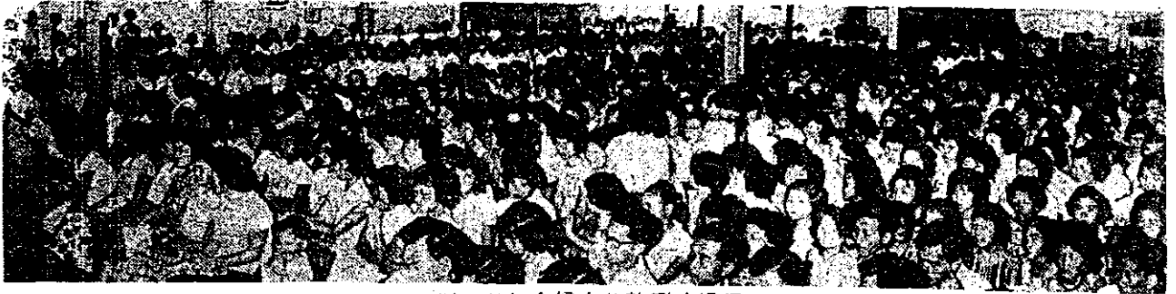
圖：黨紀念婦女節熱烈的場面