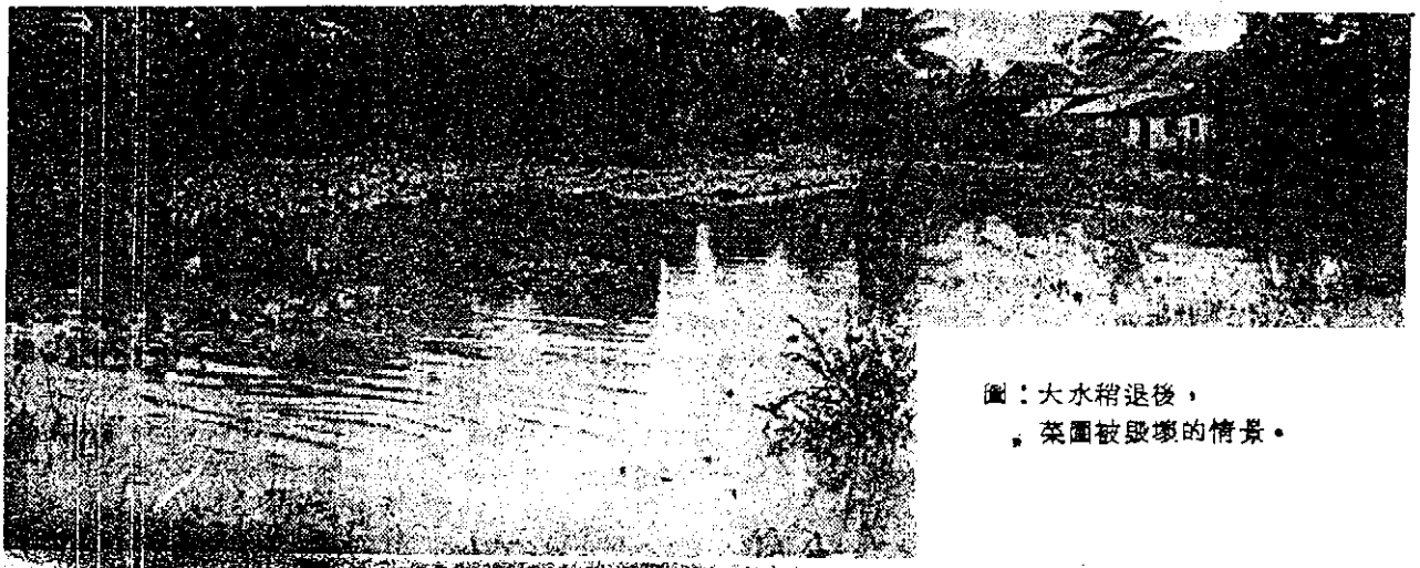
圖：大水稍退後， 菜園被毀壞的情景。