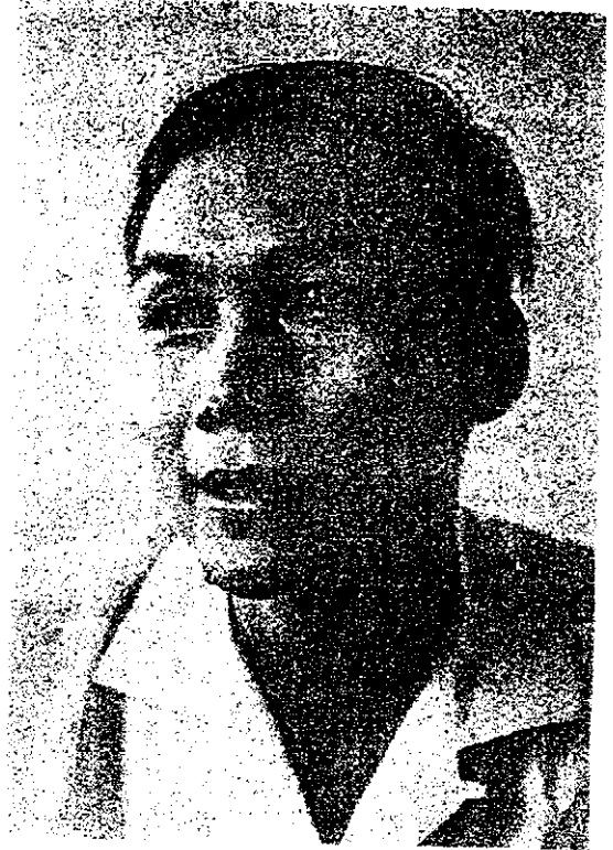
(書秘織組屈一第) 雙水方