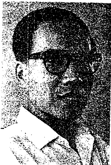
(長書秘副) 生醫楷樹傅