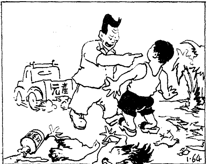
「都是你把鵝養死掉...」

為了照顧農民的生活與福利，更為了使農民不至在貧窮之上再加上貧窮而最終走上全面經濟崩潰之路，我們誠懇地呼吁政府應腳踏實地（轉入第四版）