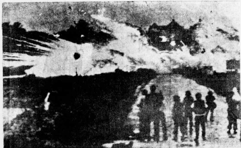
彈，結果有很多越南人民被炸死。 ← 美帝在茶邦戰役中瘋狂投下大量燃燒