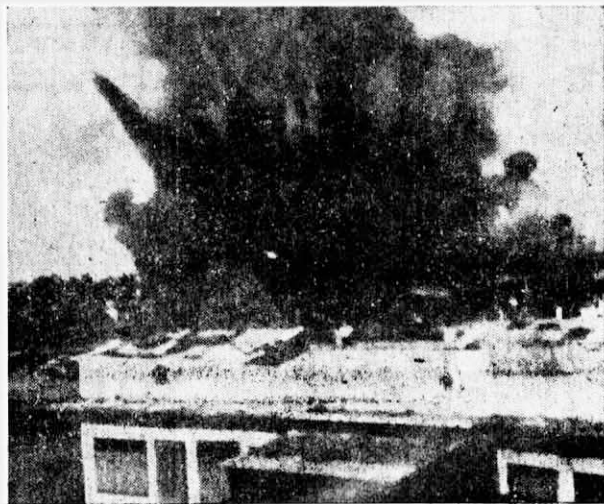
民武裝的炸彈就在這里開花。 軍所在的一個孤立圍地處二百碼地方，人 ← 在五月中戰事高潮時，安祿市西貢僞