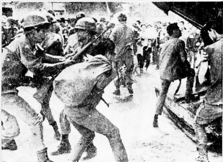
上直昇機逃命，但為美軍所阻止之影。 得曳兵棄甲、狼狽不堪，圖中所示為西貢僞軍搶 在崑崙戰役中，美僞當局被越南南方軍民打