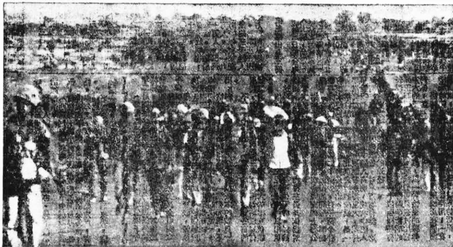
制服也敞開，夾在人群中只顧逃。 ← 越南南方軍民解放了廣治省后，西貢