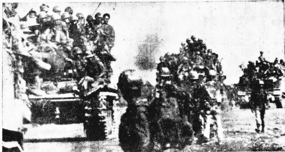
器也沒有了，但還存有戰車可連夜逃亡。 → 這是比較幸運的一群，他們雖然連武