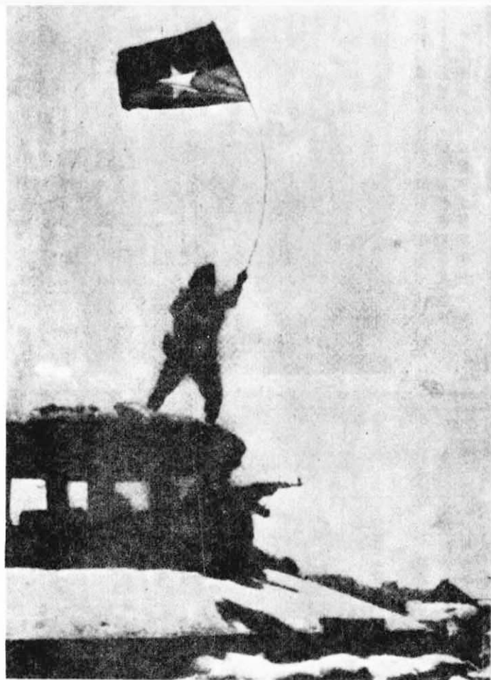
↑廣治省解放后，人民解放武裝的成員高舉越南南方民族解放陣綫的旗幟在揮舞之影。