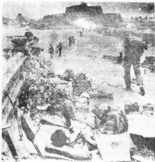
影。 → 看！這是死里逃生的殘兵敗將隨地而臥之