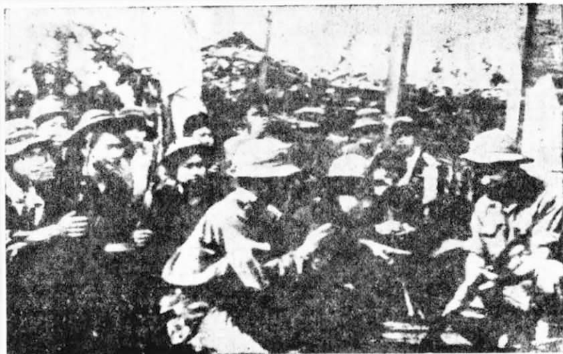
←廣治省解放后，人民紛紛加入人民解放武裝力量，充當保國衛土的戰士。