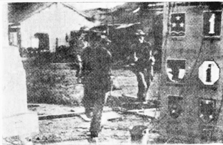
←這是越南南方軍民解放了廣治后，西貢偽軍所餘留下來的一個偽軍徵兵處。