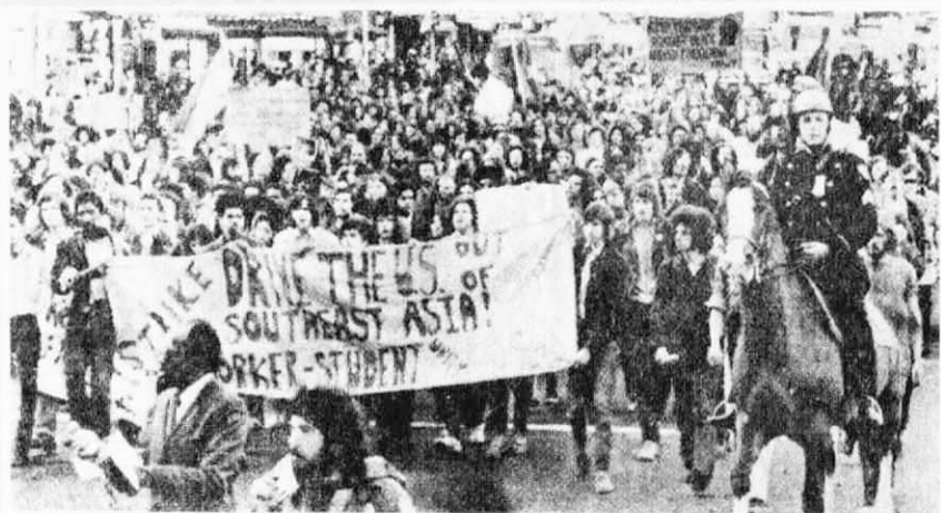
↑ 美國人民表示抗議行動將繼續下去，直至美帝退出印支戰爭時為止。這是在紐約的百老匯，另一些學生也在街頭上展開大遊行。