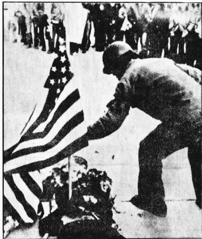
↑ 美國人民的鬥爭好得很。本月二十一日，在美國紐罕金州康特科市會堂前，憤怒的示威群眾把歷史上頭號戰犯尼克松的寫像燒燬的情形。