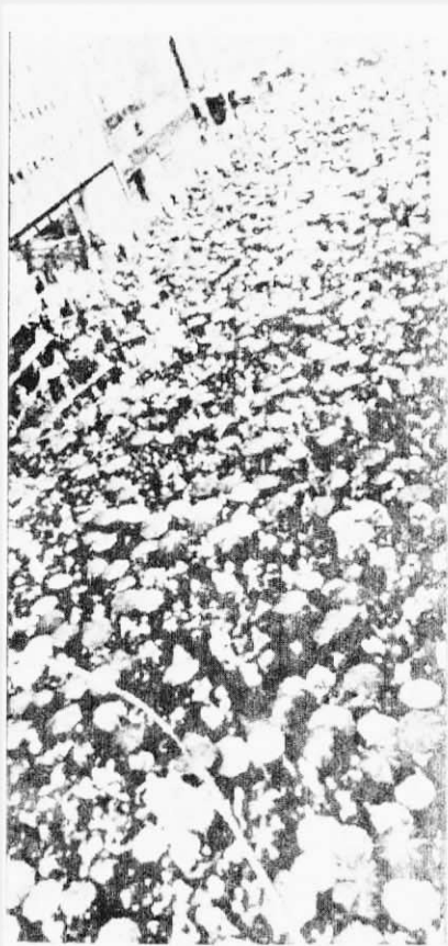
↑ 這是另一頓成千上萬的美國群眾在紐約的曼哈丹區撐着雨傘在遊行的大場面。