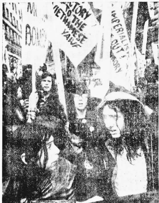
↑ 人類歷史上的頭號戰犯尼克松悍然在越南進行戰爭升級行動，激起了美國及全世界人民的激烈反對，世界各地紛紛爆發了大規模反美帝的示威遊行。在紐約的曼哈丹區，群眾在奇寒之下冒雨遊行。