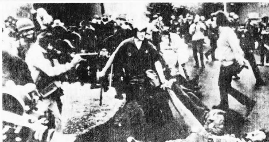
↑ 本月二十日上午，美國俄亥俄州的賴特——帕特遜空軍基地前面公路上，也有大批群眾示威，堵塞交通達十哩，這是示威者與警察搏鬥的場面。