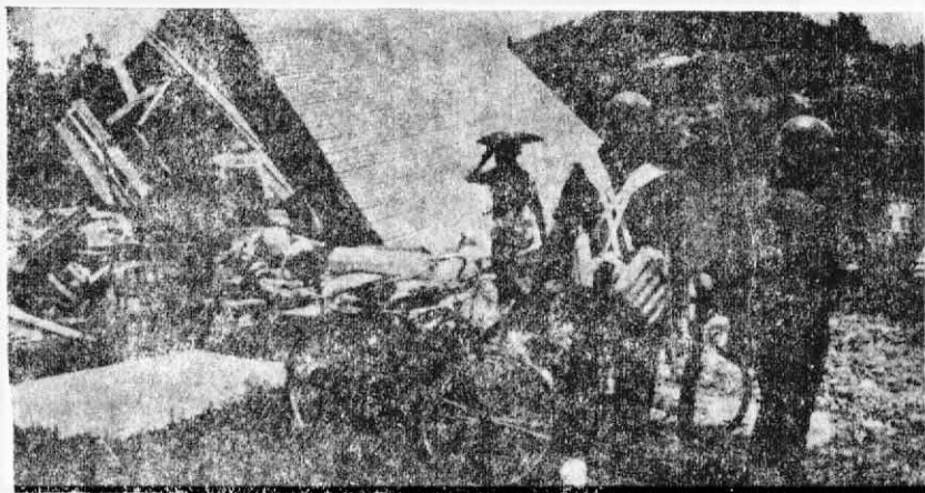
↑ 喪盡天良的拉扎克走狗集團不止一次的對付老百姓的家園，看！這是荷槍費彈的殘暴隊與暴徒在進攻群眾的家園。