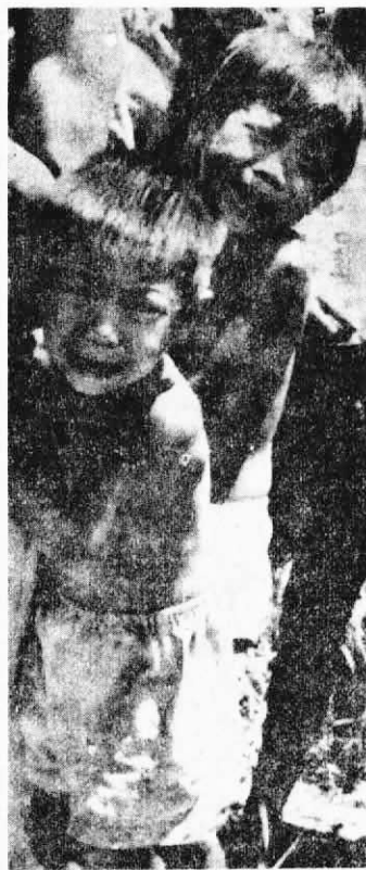
↑ 是誰毀了苦難人家的家園？是拉扎克走狗集團。將來我們一定要報仇。