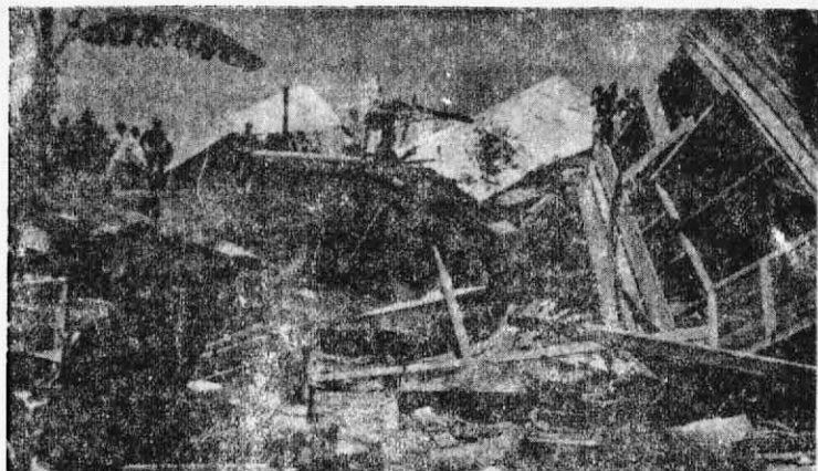
↑ 拉扎克走狗匪團於本月十日派遣大批殘暴隊與暴徒至怡保九洞新村，強蠻摧毀了二十多間木屋，造成百多個勞苦群眾失去了自己的家園，這是剝泥車在摧毀群眾的家園之影。