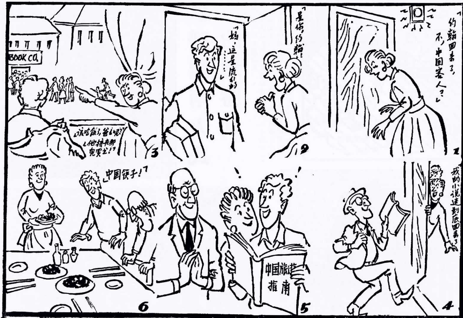
華盛頓一家庭的新事物 · 游志生 ·