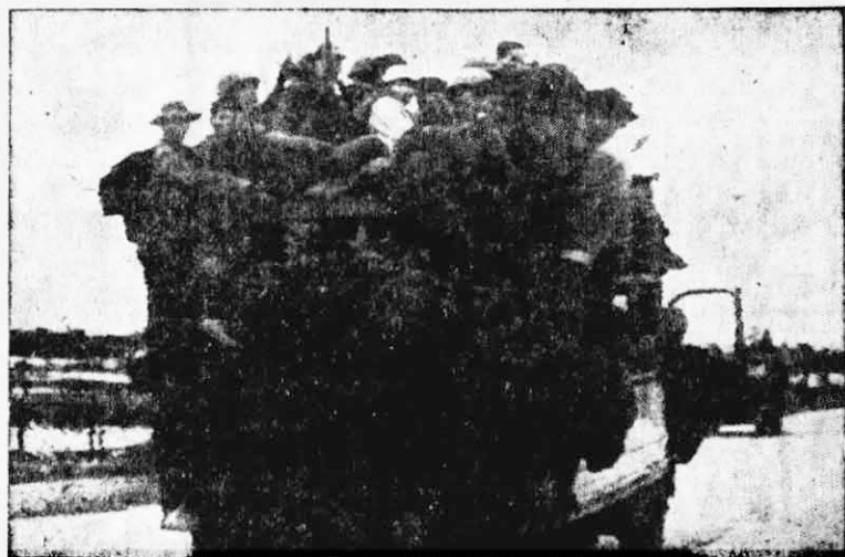
↑ 西貢僞軍被打得落花流水，紛紛豎起白旗敗退。圖為一批僞軍先恐后的跳到一輛巴士車上逃命的狼狽相。

即是等待飛機運走的西貢傷兵。也無法主持，就匆匆忙忙的趕到廣治省。圖中所示西貢傀儡政權被打得慘敗，阮文紹復歸連國會