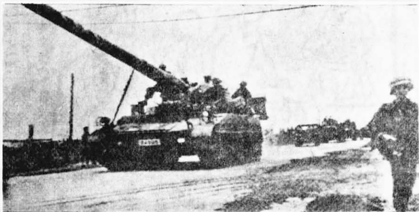
↑ 美軍與西貢僞軍被越南人民打得片甲不留，看！這些美僞的裝甲車也正在逃命。馬來亞人民要歡呼：越南人民打得好！越南人民打得妙！