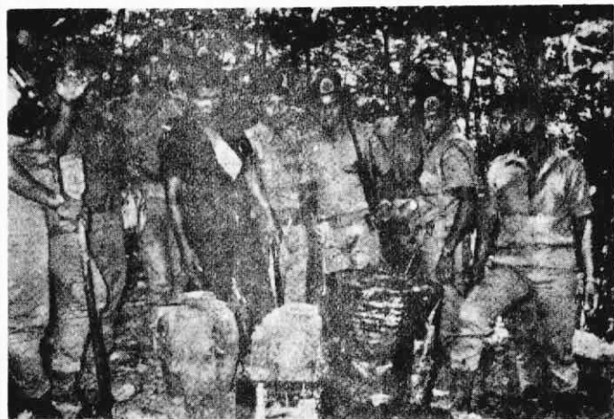
↑拉扎克走狗政權藉口“破獲藏糧”，對我同胞進行血腥鎮壓，在它們的野蠻行動中，已有一人被害而死。