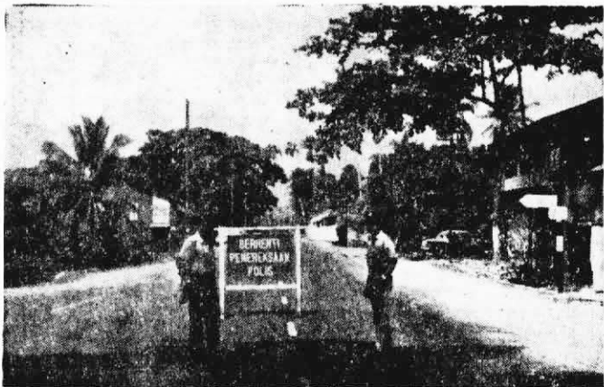
↑拉扎克走狗政權於本月十一日突然宣布在吉打州的華玲、宛拉峇魯、居林以及霹靂州的司南馬等地區實行“戒嚴”，對該地區的群眾進行迫害，圖為偽軍警到處設下路障之情形。