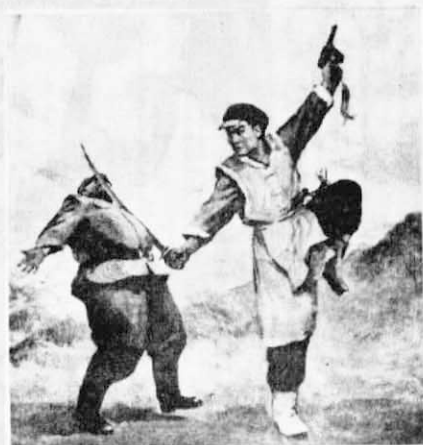
刀劈鳩山 一場短兵相接的搏鬥，游擊隊盡殲日寇，處死叛徒，刀劈鳩山。——第十場 伏擊殲敵