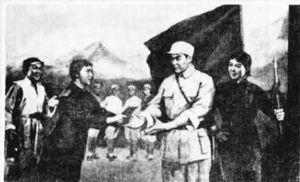
——第十一場 勝利前進 碼莊重地交給游擊隊長。 勝利完成任務 鐵梅把密電