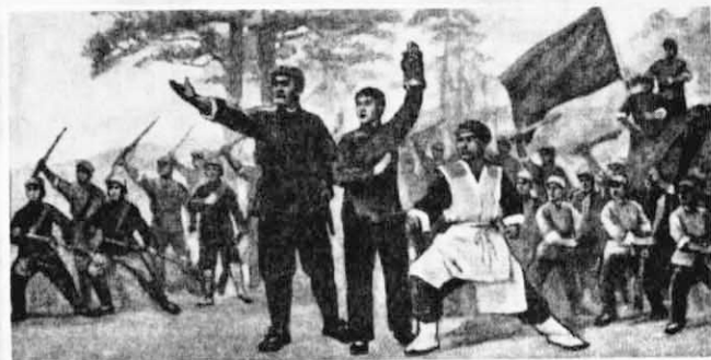
光芒萬丈 眾游擊隊員揮舞刀槍，歡應勝利。 鐵梅高舉紅燈，光芒萬丈。——第十一場 勝利前進（續完）