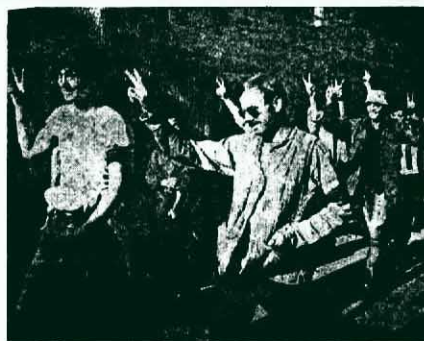
↑ 去年五月十七日，美國反戰軍人也在漢城市區進行示威，雄辯的證明了美國人民的反戰情緒。