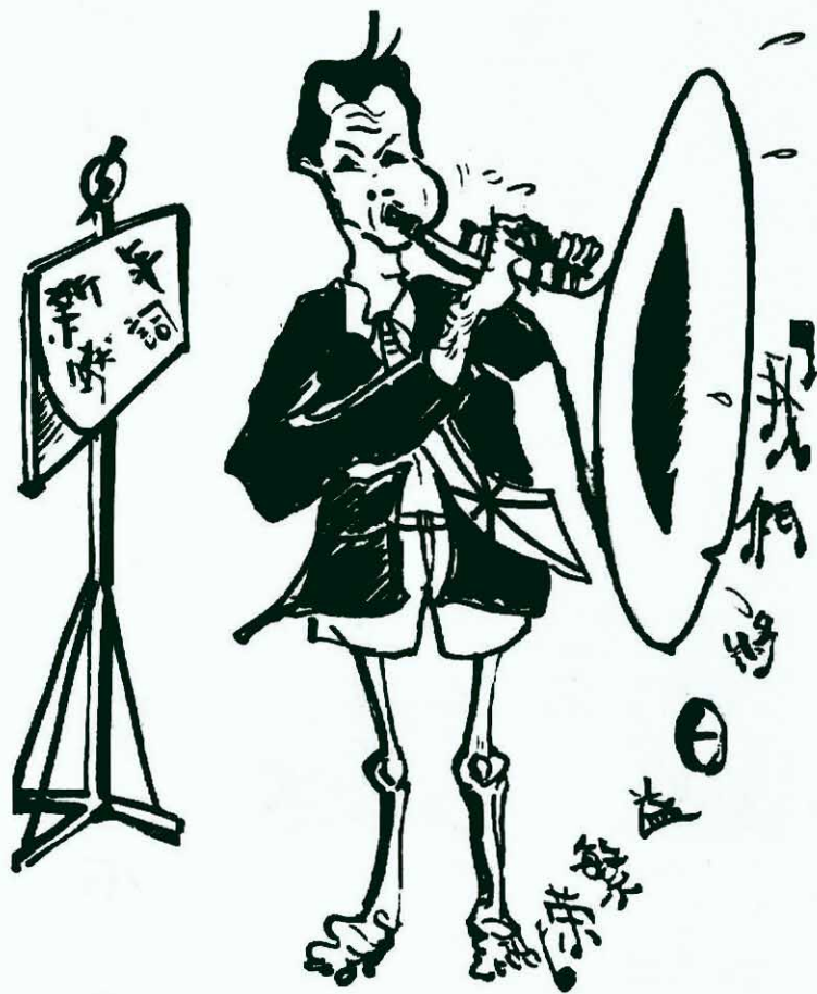
歪嘴吹喇叭 —— 一團邪氣 · 雷鋒 ·