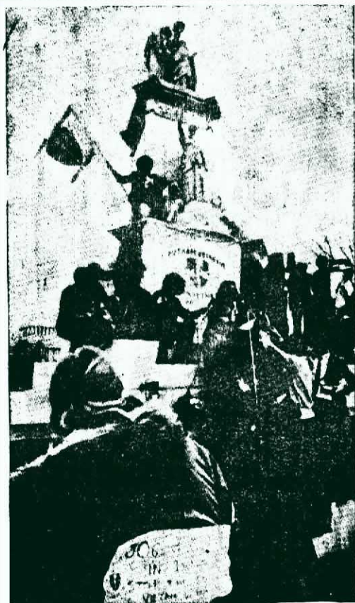
↑ 美帝的狂轟濫炸，激起了其國內人民的反對，就是退伍軍人也在去年十二月廿八日，在華盛頓展開反戰示威，要求美帝立即停止轟炸越南北方。圖為示威者爬上和平紀念碑之情形，圖的左邊是美國國會大廈的背景。