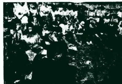
↑ 在去年五月十六日，美國的軍人就在日本的沖繩進行反戰集會。