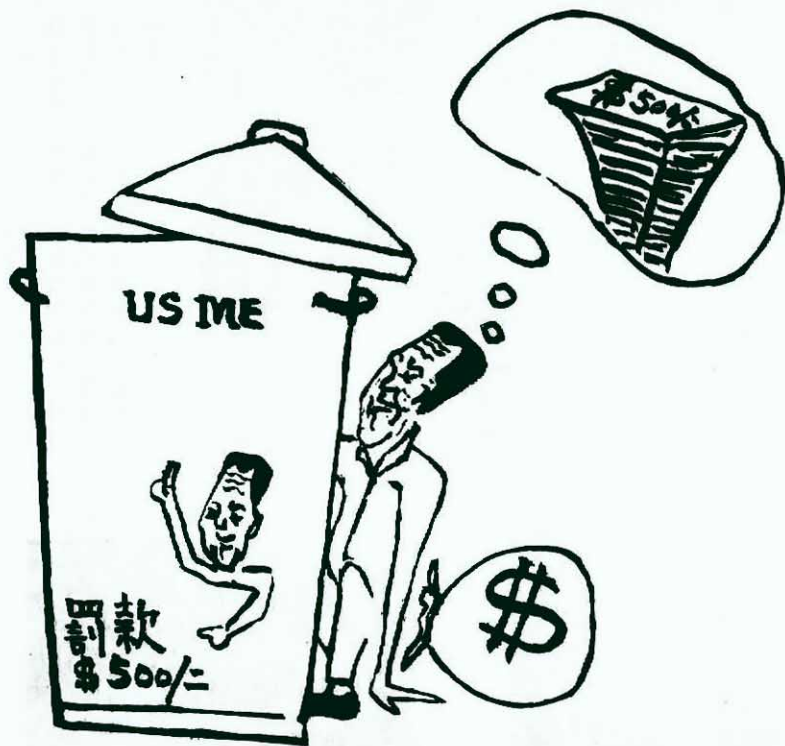
有 甚 于 搶 劫