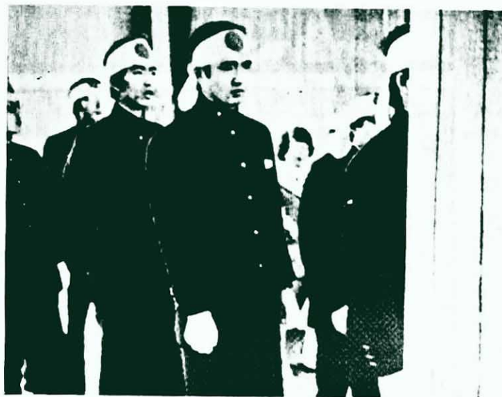
↑ 「紀元節」那一天，日本軍國主義大搞各種「紀念」活動。頭上繫有太陽旗頭巾的右翼學生，列隊向「皇軍」的「英靈」「默哀」。