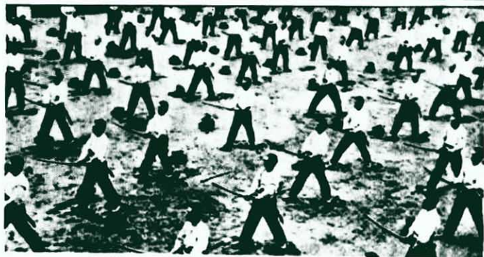
↑ 這是當年「皇軍」操練用以殺人的「劍道」之場面。