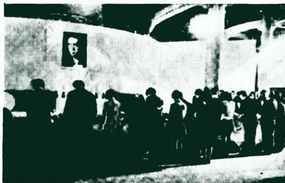
← 隊，禮神「日」。 三進右宜 鳥行軍翼揚 由軍紀事份「 夫政子武 為變在士 了，為道 鼓剖他「 動腹舉的 「自行狂 自殺一熱 備後粹精