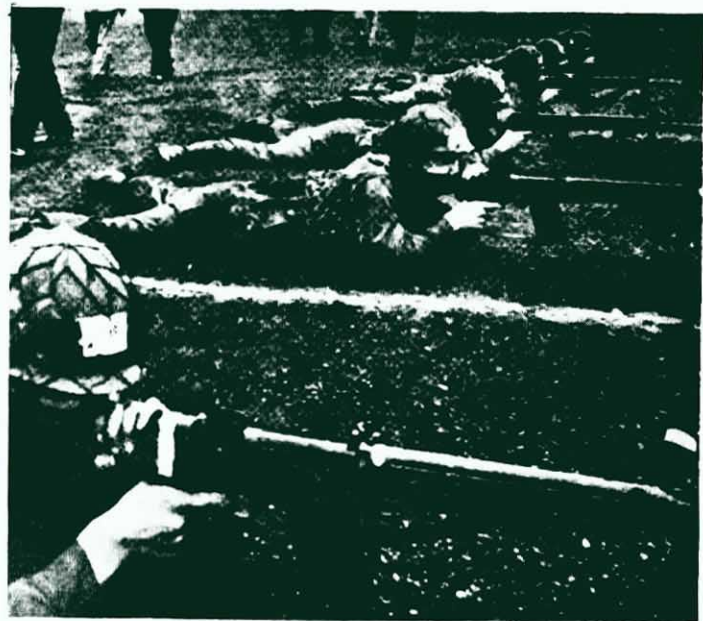
↑ 今天的日本軍隊，在名稱上以「自衛隊」代替了當年的「皇軍」。是目前在亞洲「自由世界」中最大的武裝集團。