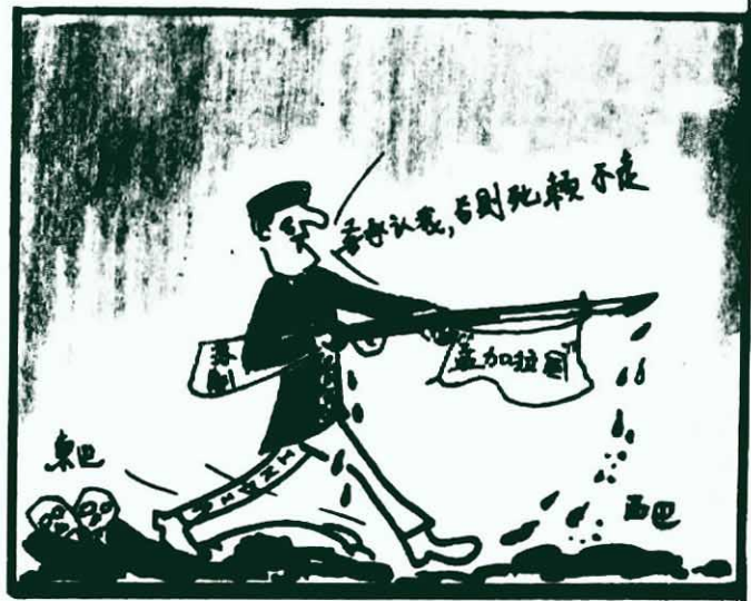
死賴不走。 印度反動派槍口對准巴基斯坦， 紅紐作