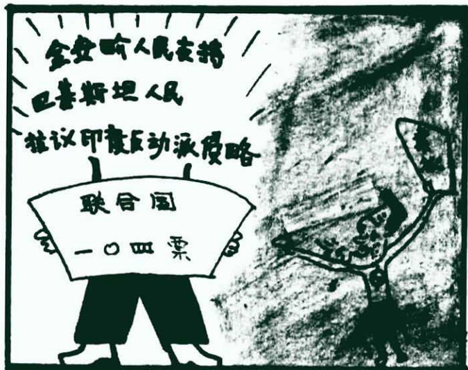
大唱反調。 李光耀集團勾結印度反動派， 紅紐作