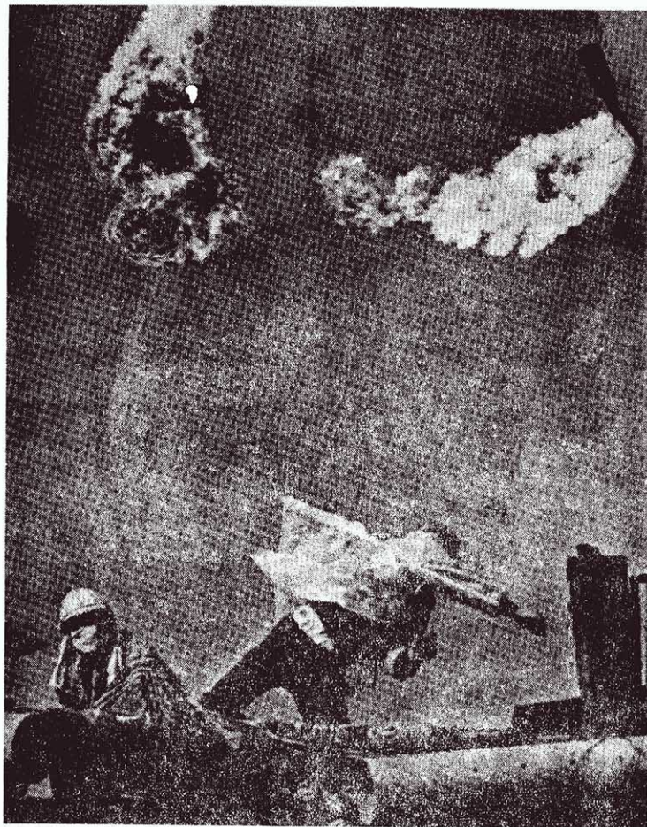
← 成田市警察死亡，圖為現場警察展開斗争，日本革命群眾在反動警察的冒烟之影。