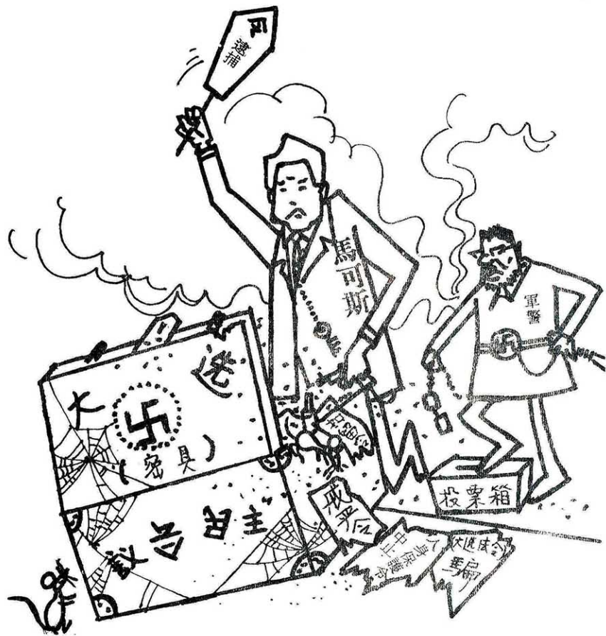
馬可斯的「大選」把戲