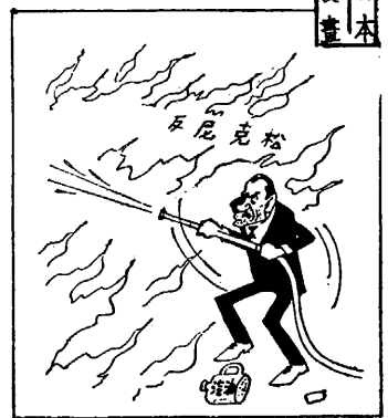
中之團包火烈入陷松克尼

尼克松的新的經濟政策正像他過去所吹噓的其他政策一樣，絕對解救不了美帝國主義內外交困的處境，反而引起國內外許多矛盾的激化。造成了資本主義世界戰后以來最嚴重的貨幣制度的危機。這場危機目前還在繼續發展中。