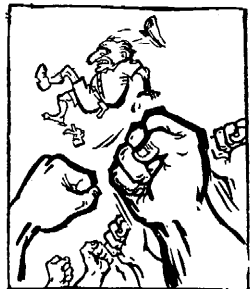
• 帝國主義和反動派都是紙老虎。

“我們正在前進。”“我們的目的，一定要達到。”“我們的目的，一定能夠達到。”我們的黨將在中國革命和世界革命的偉大門爭中，建設得更加偉大、更加光榮、更加正確。