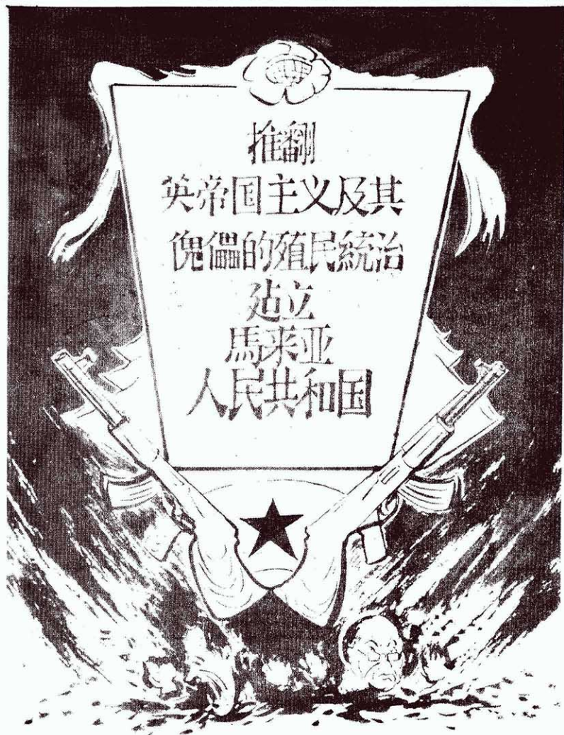
槍桿子裏面出政權！