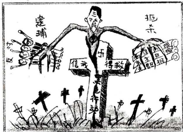
群魔亂午，報人遭殃。