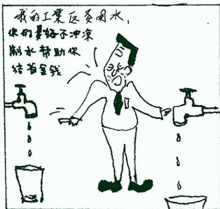
談“水”色變也。 紅紐作