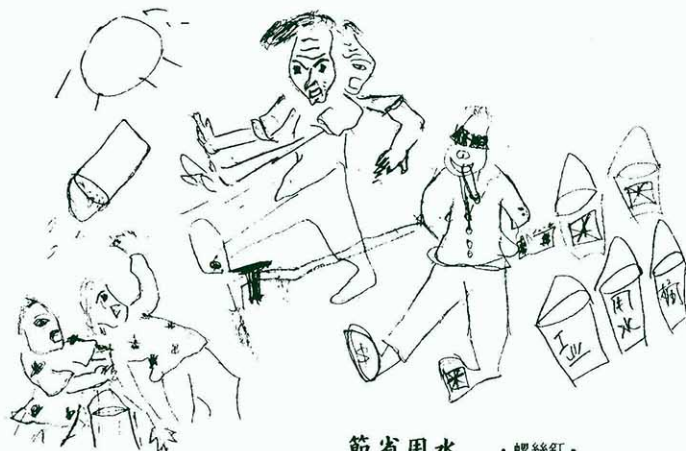
節省用水 · 螺絲釘 ·