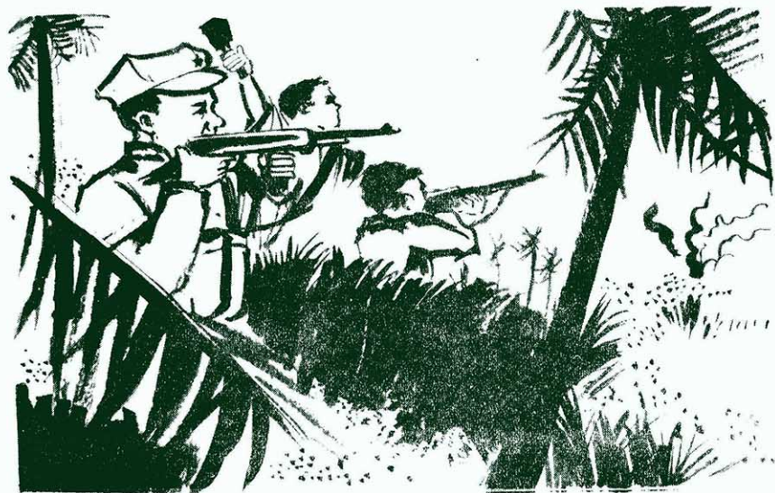
英勇善戰的馬來亞民族解放軍 丹心 1971.5A