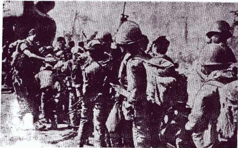
恐后，登機逃命。 ← 圖為入侵老撾的美帝和南越偽軍爭先