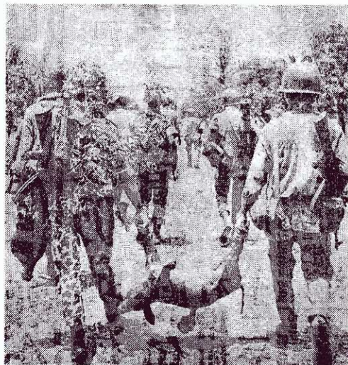
↑ 朗諾偽軍無惡不作，連偷帶搶，連群眾的豬與雞都拿去當晚餐。