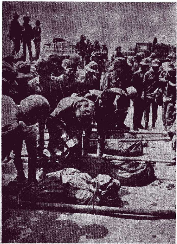
↑ 這一具具的偽軍遺體，是在車邦戰場上運到溪生的。