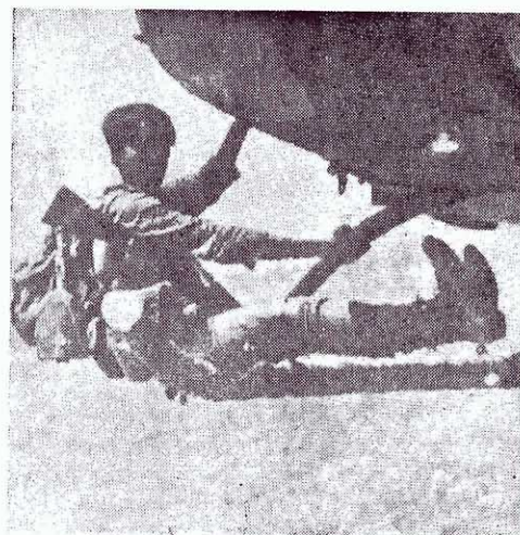
↑ 你知道他在幹什麼嗎？這是一名僥倖逃生的南越偽軍，他是抓住美帝直升機的滑橈而逃命的，有一些偽軍因抓不穩，在高空跌下而一命嗚呼！