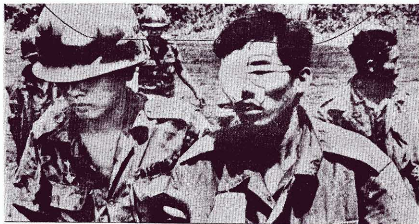
← 慘敗之狼狽情景。從這個狼狽軍的表情便可以看出它們