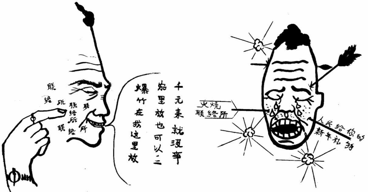
(一) 今年怪事特別多 又有人想發橫財