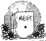
林副主席著作選讀