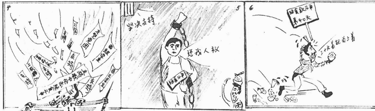
支援函件，如雪紛飛。