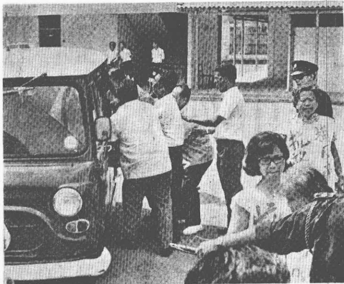
↑ 一位光榮家屬，正被一群狗警強蠻推上殘暴車。