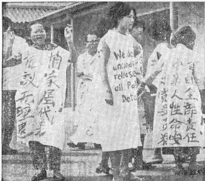
↑ 我們強烈抗議反動派無理逮捕家屬代表，抗議反動派法西斯迫害我獄中親人，立即完滿解決獄中親人所提的五點合理的、正義的要求！