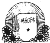
林副主席著作選讀