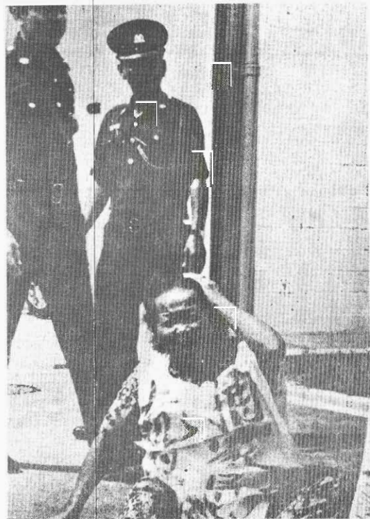
↑ 看吧，這就是反動派對一位手無寸鐵的老弱婦女的血腥暴行！