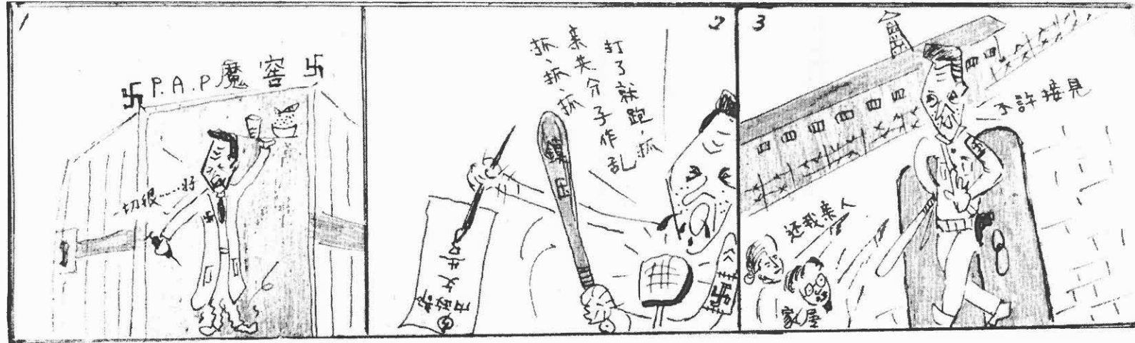
劊子手的謊言徹底破產。