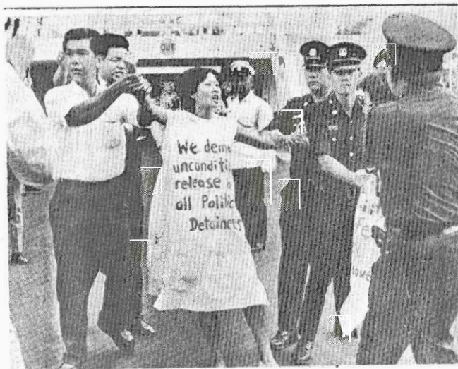
↑ 對一位手無寸鐵的婦女，何必如此囂張？！