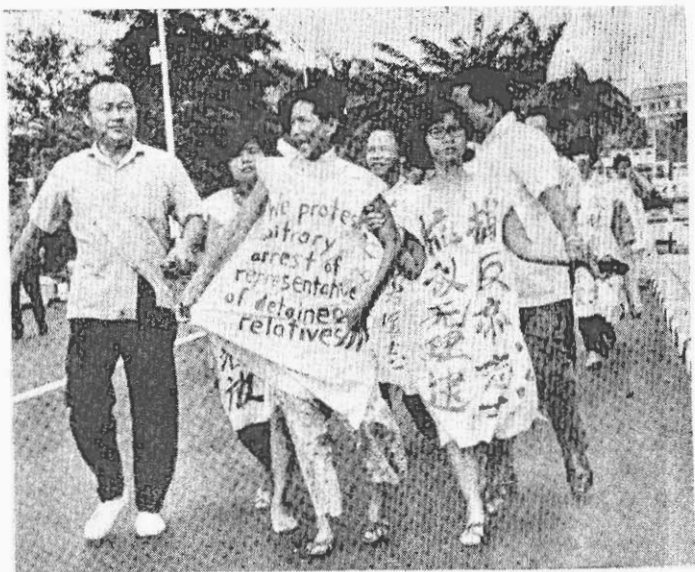
↑ 看！狗警正動手逞兇，但這也阻止不了正義的伸張。