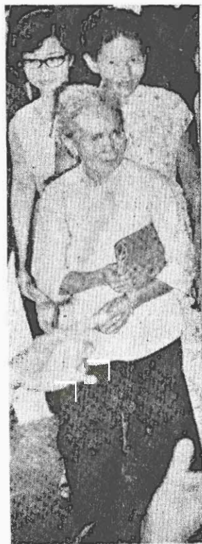
← 人，斗支上的曾爭援僞一正經，獄法位義光抗中庭七斗榮議親，十爭坐反人準多，牢動的備歲在，派正進的一並的義行老九在法斗另婆六黑西爭一婆七牢斯，次，年中暴又的為六展行一斗了。開。次爭支一英今被！援三勇天反獄事的，動中件絕為派親中食了控