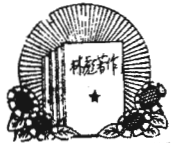
林副主席著作選讀