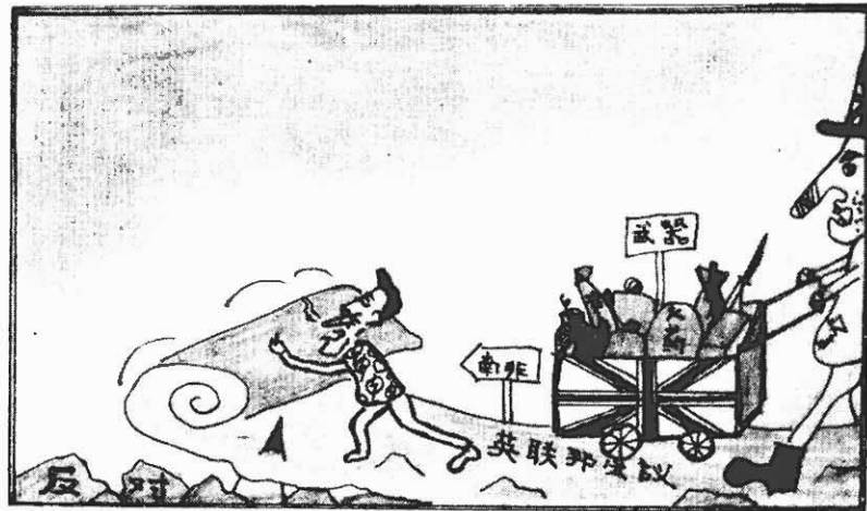
英帝的忠實走狗 · 朝陽 ·