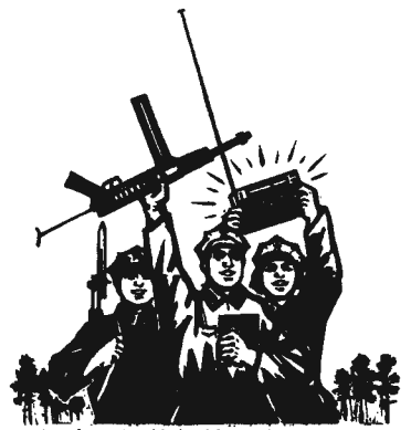
馬來亞民族解放軍響應 馬來亞共產黨的偉大號召