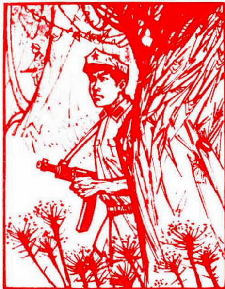
英雄的馬來亞民族解放軍在叢林中