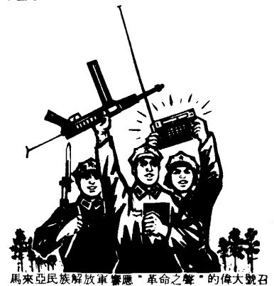
馬來亞民族解放軍響應“革命之聲”的偉大號召

衆的配合下，人民武裝力量幾個月來連續打了幾次勝仗，打死打傷反動軍警數十名。武裝鬥爭形勢越來越好。