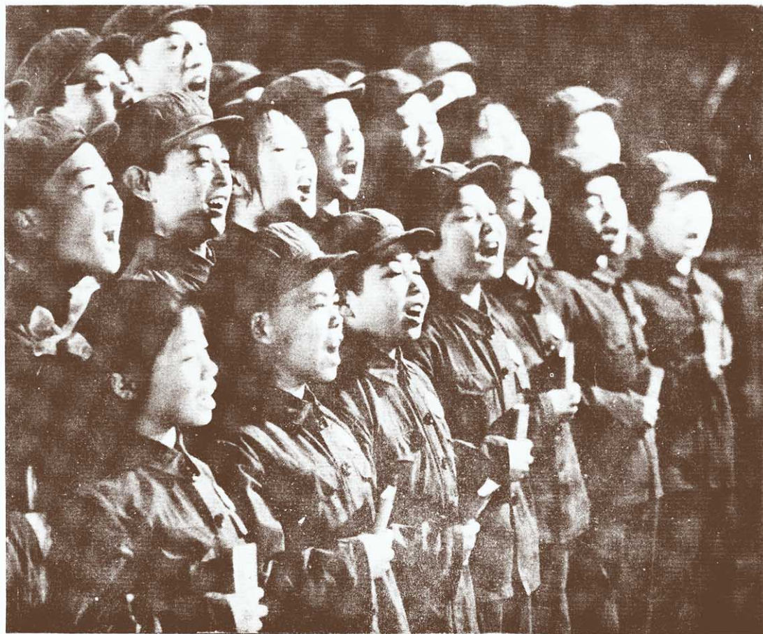
由中国人民解放军医务工作者治愈的聾哑人纵情高歌《东方红》。