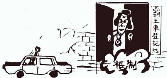
門前冷落“登記”稀 · 朝陽 ·