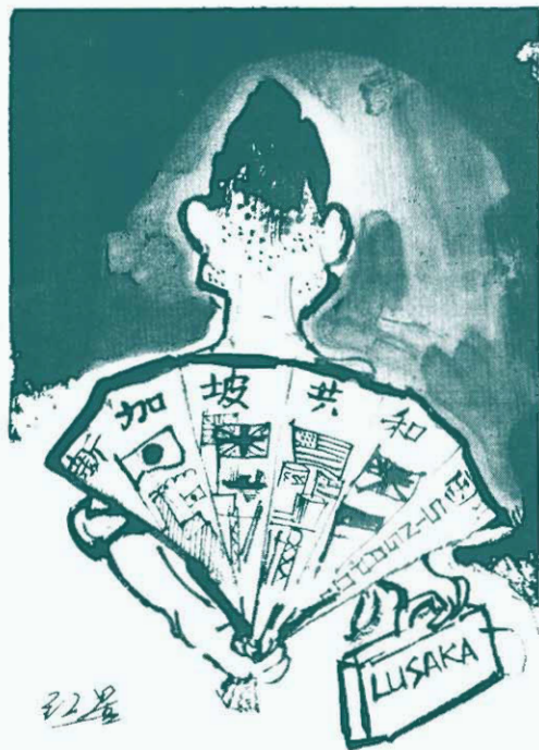
披着“不結盟”外衣的帝國主義走狗