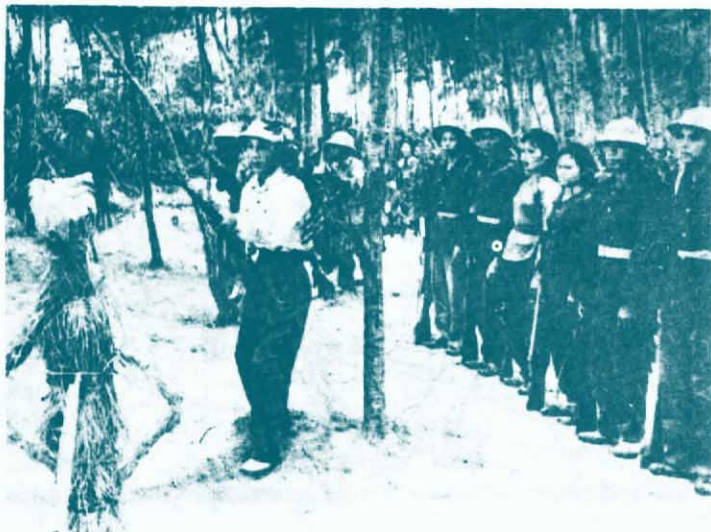
↑越南愛國軍民苦練殺敵本領，抗擊美帝的侵略