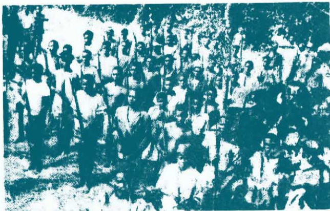
←武裝戰士進行軍事訓練，戰鬥在剛果西部的愛國