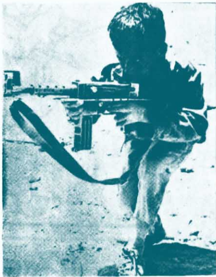
←巴勒斯坦少年突擊隊員正在進行軍事訓練。

義垂侵会，東門略擊戰不葬。全 陣死略消各思想用各士上的人形。 戰營爭和滅國教暴國在冲美民形。 鬥的薄着殺民民在下革，的里敵其的共 七西，，的在，命，的里敵其的共 十年，狂心抗無蓬抗子練呈走汪洋義 代，奄對妄力不勃擊弟射英狗，大曙 帝一民借。的展帝|領一將之照 國息發此可毛武的|領一將之照 主、動機是澤裝侵游。蹶埋中遍