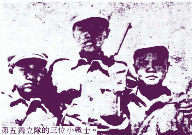
第五獨立隊的三位小戰士。