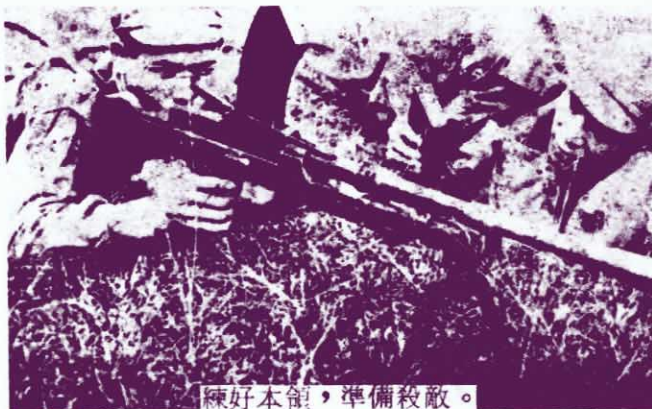
練好本領，準備殺敵。

同胞們：要生存，靠鬥爭，行動起來，讓我們緊緊的團結在英雄的馬來亞共產黨的旗幟下，發揚暴力革命的優良傳統，從各個方面展開鬥爭。讓我們踏過先烈們的血跡，為打倒美英帝國主義及其拉赫曼、拉扎克、李光耀走狗集團，建立一個馬來亞人民共和國而鬥爭到底！