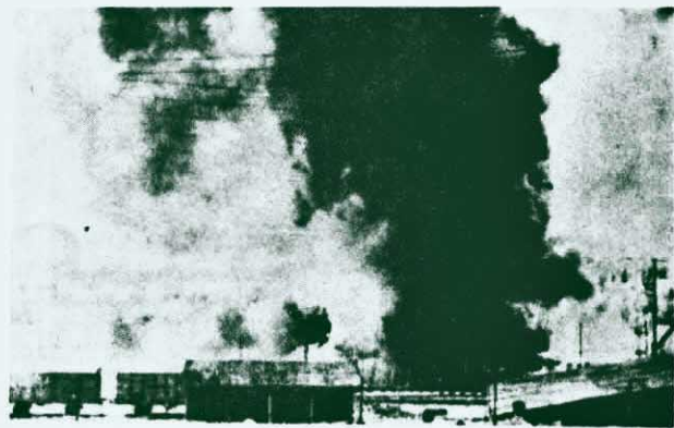
↑ 以色列猶太復國主義者的鐵路綫和火車站，遭到英雄的巴勒斯坦游擊隊的猛烈襲擊。

軍及英帝殖民軍，取得了輝煌的戰果。打出了一片大好的形勢，消滅了大量的以色列侵略，人民武裝部隊英勇奮戰，而且不斷的發展壯大，毛主席的「槍桿子里面出政權」的偉大真理鼓舞下自己的實際鬥爭經驗、學習和運用毛主席著作。在裝鬥爭。他們結合英帝殖民統治的武器——以色列及美帝國主義的侵略艱苦，堅持反抗陣綫的領導下，不勒斯坦民族解放運動和阿拉伯灣人民地區的人民，在巴勒斯坦和佐法爾阿拉伯半島的