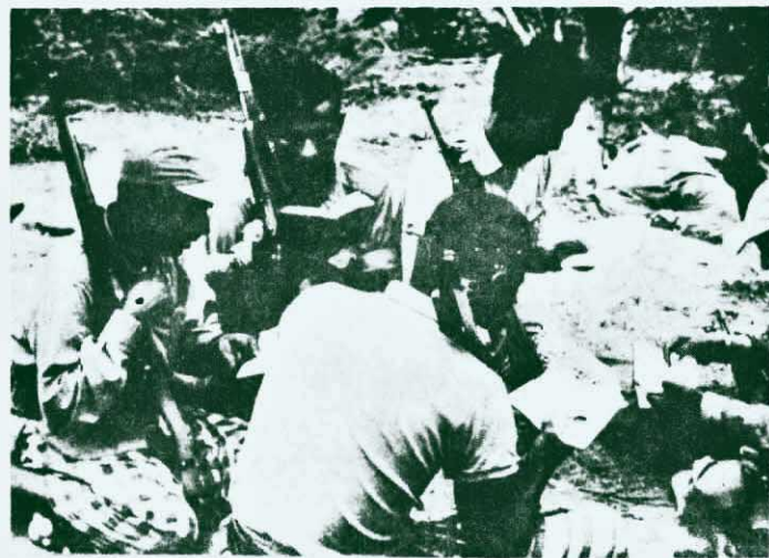
↑ 佐法爾地區的人民解放軍戰士，利用戰鬥和軍事訓練的間隙，認真地學習毛主席語錄。