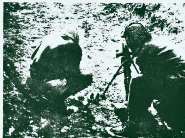
→ 在炮擊以色列侵略軍。圖示巴勒斯坦的游擊戰士正