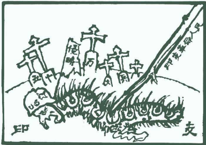
← 英帝算什麼？ 看吧！美帝既如虫，