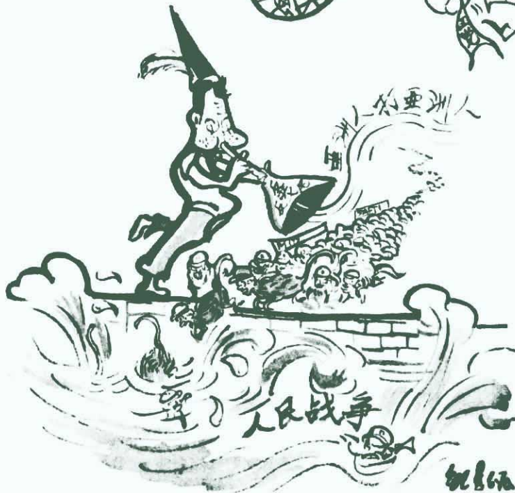
帝國主義及反動派必 淹沒在人民戰爭汪洋大海之中