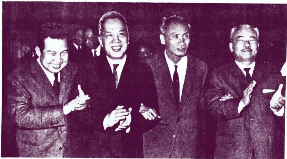
↑ 印度支那三國人民的領袖——柬埔寨國家元首、柬埔寨民族統一陣綫主席諾羅敦·西哈努克親王（左一）老撾愛國戰綫黨主席蘇發努馮親王（左四）越南南方民族解放陣綫中央委員會主席團主席、越南南方共和臨時革命政府顧問委員會主席阮友壽（左二）越南民主共和國政府總理范文同（左三）在一起。