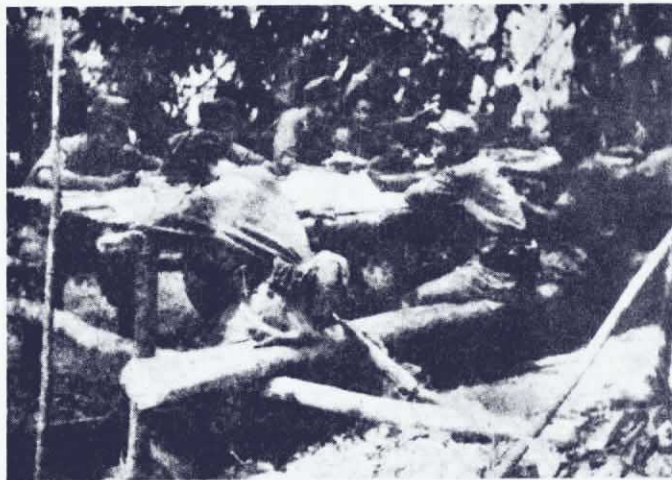
↑ 我國各族人民的子弟兵——馬來亞民族解放軍，高舉革命武裝鬥爭的紅旗，同美英帝國主義及其走狗進行了英勇頑強的鬥爭，打出了一派大好革命形勢。圖為馬來亞民族解放軍戰士開會總結經驗，以便進一步發動群眾，更有效地消滅敵人。

六月廿六日，我民族解放軍第八支隊某部在吉打、泰國邊境地區，成功地伏擊敵人的一支巡邏隊，打死打傷敵人十多個，繳獲一些武器和其他軍用物資。在這之前，民族解放軍消滅了一個罪大惡極的敵人奸細。