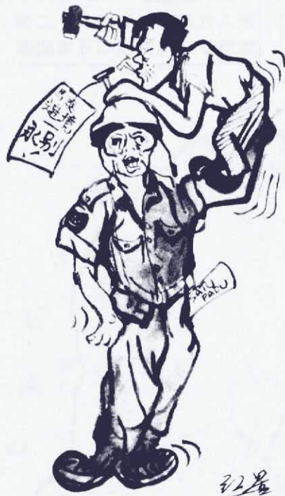
尼克松主義龜壳 保不住拉李狗命!