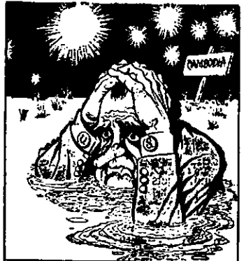
美國 畫圖 中泥的塞埔東在掉機克尼

五月下旬的一天，我在舊金山，這一天很奇怪，有幾種報紙一下子全都賣光了。我到處打聽原因，美國人說：“這些報刊刊載了毛澤東主席的聲明。”這時候我忽然熱淚盈眶，在離開祖國遙遠萬里的地方，這句話令我感受到從未有過的溫暖，感到從未有過的光榮。