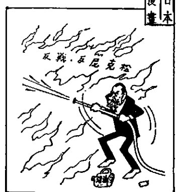
中之團包火烈入陷松克尼