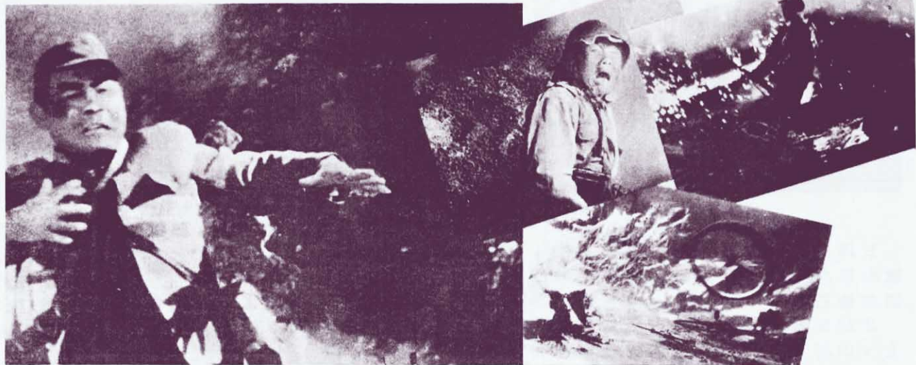
地雷炸得敵人人仰馬翻，死傷慘重。

趙家莊人民“從戰爭學習戰爭”。他們創造了踏雷、拉雷、絆雷、子母雷、連環雷、釘子雷、碎石雷、鐵夾子雷……等和多種迷惑敵人的辦法，虛虛實實，真真假假，造成敵人錯覺，使敵人完全處於被動挨打的地位。當日本侵略軍向趙家莊瘋狂進犯時，主力部隊同趙家莊民兵一起並肩戰鬥