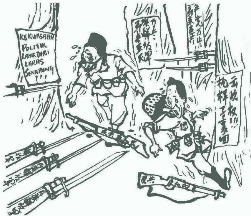
反對反革命的暴力 以革命的暴力