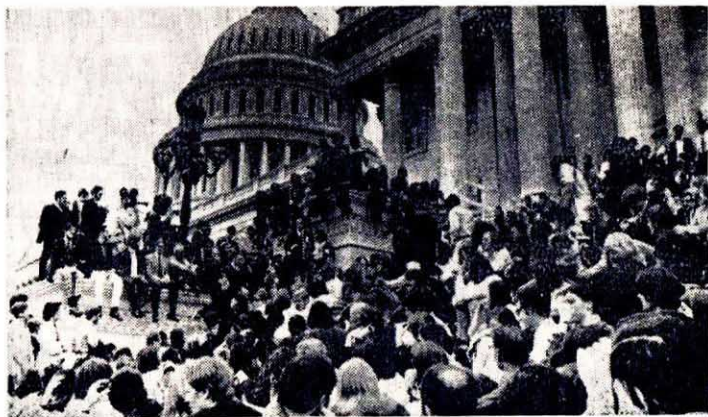
行示，支徑威有援美，門力了帝激爭地印人起風打支來千雲了東埔萬，美反的擴國對大侵階略印人爭的支戰的爭的烈對西斯。雷和