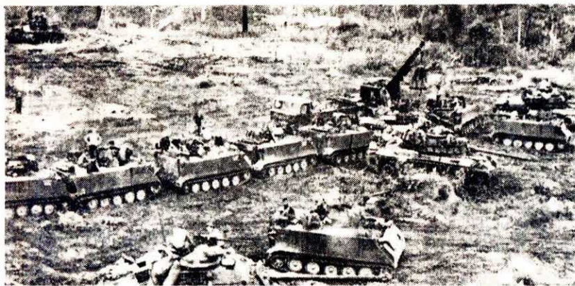
← 美帝國主義為挽救其在越南戰場上的敗局，於五月二日悍然大舉進兵柬埔寨，擴大侵略印度支那戰爭，對柬埔寨人民，印支人民和全世界人民犯下了滔天罪行。圖示美帝派遣裝甲車在空軍的掩護下入侵柬埔寨的情景。