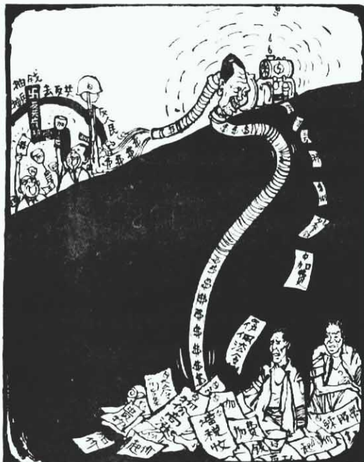
傀儡們加薪的來源