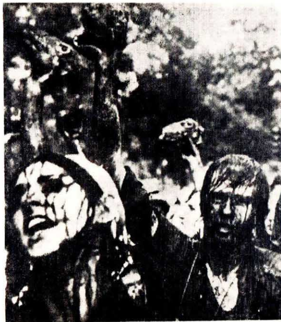
略示統印威治美支者者國戰全把人民爭身他們反形血當對美多舉帝種着進多半樣爭的東埔圖表示，美反。擴國對大侵有些