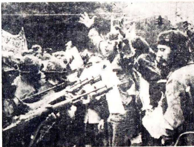
← 數絲開，千網門把本美，爭反月國。侵進他們十年軍毫傳，憤，不單美與同畏掛國們前懼在紐推來地憲傑倒鎮壓身的賽該壓身的迪軍的對刺克營憲準刀堡的兵刺上，鐵展刀。