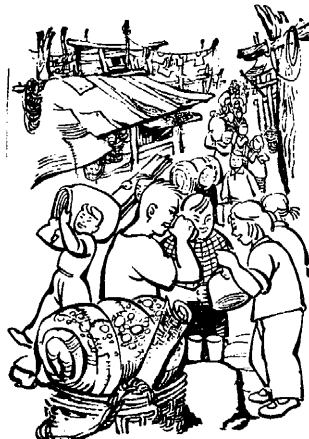
發揚三個「互相關心」精神幫助街坊鄰居 紅天作

至於由殺人兇手發起的“親善委員會”，那就更加騙不了人了。這又是一幕新的丑劇，它令人想起了二十八年前的日本法西斯在我國各地搞的什麼“維持會”。現在，廣大人民看得很清楚，法西斯政權是在“團結”、“親善”的招牌掩護下，更全面、更野蠻的實行民族壓迫、民族屠殺的政策。這是更陰險、更毒辣的陰謀。一切真正爭取民族團結的人，要組織起來，武裝起來，行動起來，為徹底砸爛法西斯政權而共同奮鬥！