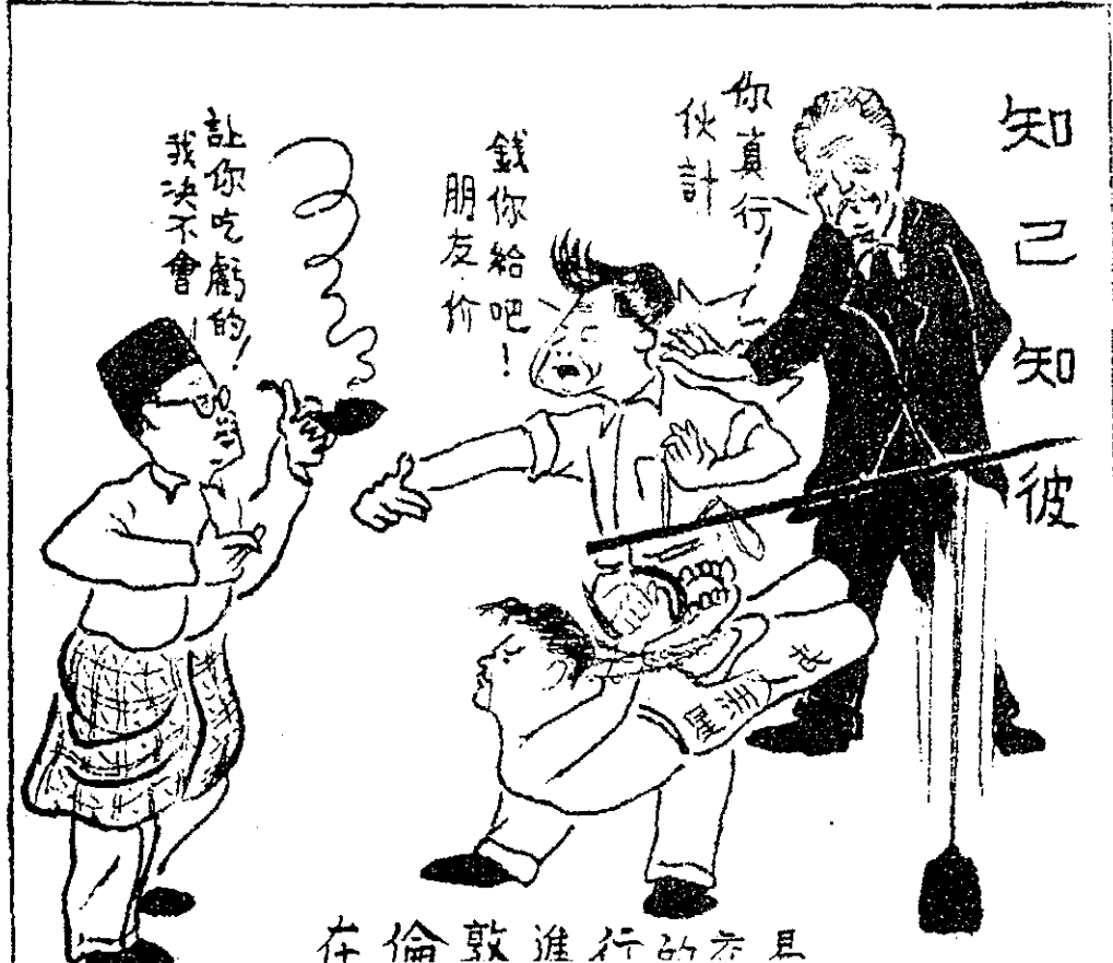
在倫敦進行的交易

這一期，我們創設一版「漫畫之頁」，乃希望美術工作者今後多多把自己的專長，用之於社會改革事業，把你的畫筆變成殖民主義奴僕們所畏懼的投槍和匕首。我們希望漫畫來稿不要畫得太大，第一方便我們照原樣刊出，第二可節省制版時間和費用，敬請投稿漫畫的朋友們留意。